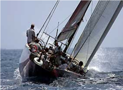
Winning Team durch Excellence!